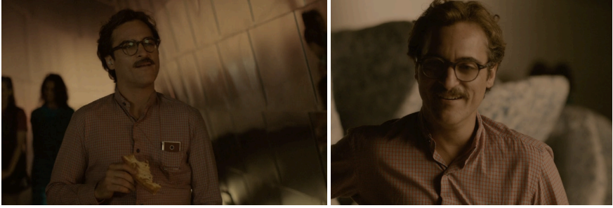
Samantha trúir Theodore fyrir draumum sínum á meðan þau eru í göngutúr.

áttar sig á því að hún sér eitthvað við hann og að því leytinu er þessi ást narsísísk; hann er eins og sjálfsánægða (og oftast myndarlega) konan sem þarf ekki að elska heldur bara að vera elskuð, sem Freud lýsir í „Um narsisisma“. Þar skilgreinir hann tvær leiðir til þess að elska, þá narsísísku og þá sem byggir á viðfangstengslum, en hann tengir þá fyrrnefndu konum og þá síðarnefndu körlum. Bæði líffræðilegir og félagslegir þættir spila þar inn í, til dæmis bendir Freud á að narsisismi kvenna bæti þeim upp þær samfélagslegu skorður sem þeim eru settar í makavali, líkt og sjálfsánægja þeirra sé þeim huggun í karlaheimi þangað til þær eignast barn og tekst þá fyrst að beina ást sinni að viðfangi. 38 Á meðan karlar hneigjast til þess að verða háðir ástinni sinni og setja hana jafnvel á stall, „elska konur [að minnsta kosti þær sem elska „eins og konur“] einungis sig sjálfar með þeim tilfinningahita sem einkennir ást karlanna á þeim.“ 39